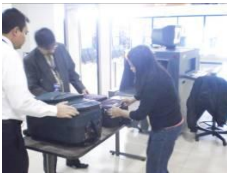
Figura No. 7 Seguridad Aeroportuaria