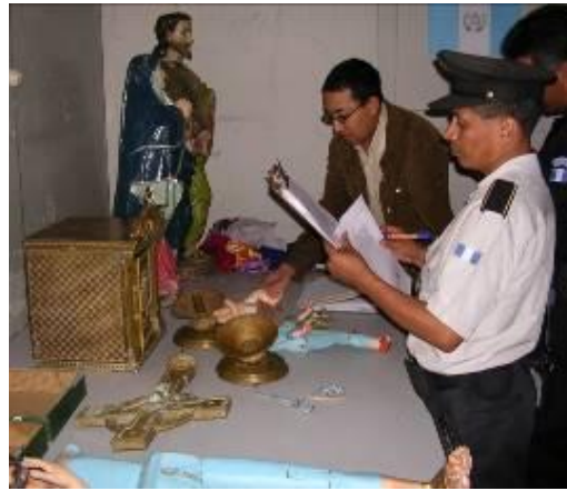
Figura No. 6 Cooperación Policía Nacional Civil