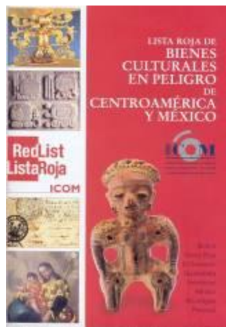
Figura No. 18. Lista Roja Centroamérica y México.