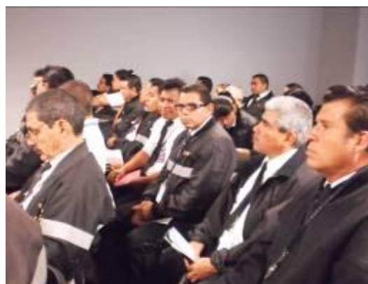
Figura No. 12 Capacitación Seguridad Aeroportuaria