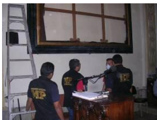
Fig. 4 Colaboración con Policia Nacional Civil