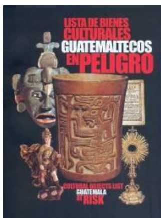
Figura No. 19. Lista de Bienes Culturales Guatemaltecos en Peligro.