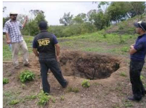
Figura No.8 Fiscalía Específica Ministerio Público