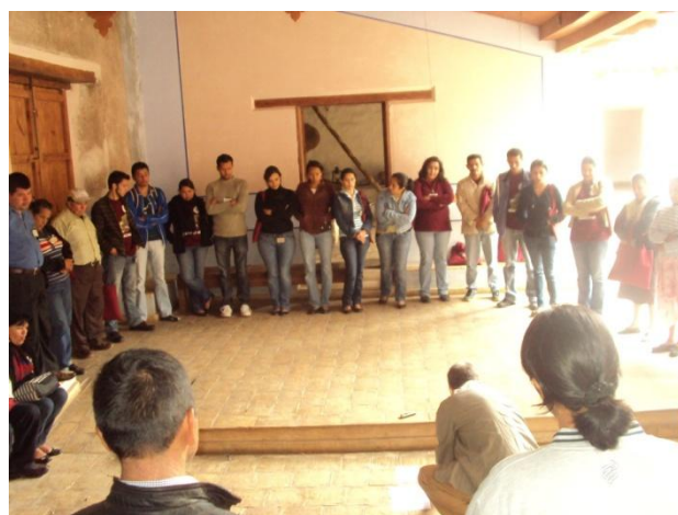
Figura 3. Taller de Guarda-recursos Culturales en Gracias, Lempira.