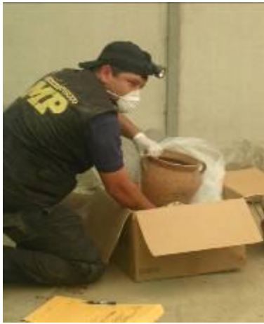
Figura No. 5 Resguardo Bienes Culturales