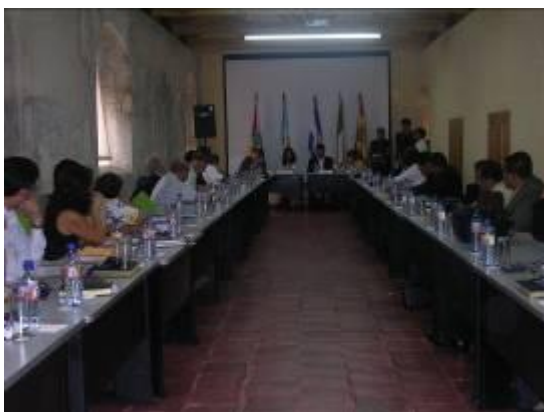
Figura No. 13 Capacitación Carabineros de Italia