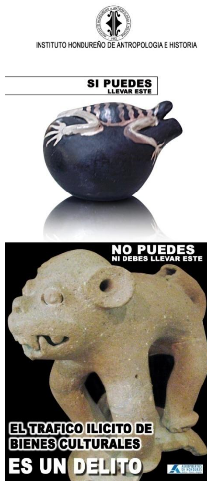
Figuras 4 y 5. Afiches para promover sensibilización en la lucha contra el tráfico ilícito de bienes patrimoniales.