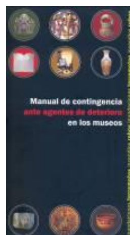
Figura No. 13 Manual de Contingencias