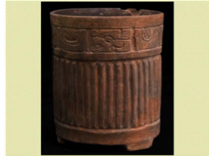
Figura 6. Ficha de Inventario de Objetos Arqueológicos provenientes de proyectos de investigación.