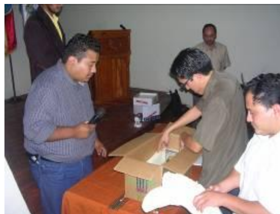
Figura No. 10 Capacitación Ministerio Público