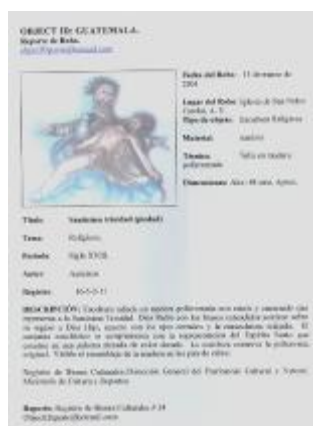
Fig. 3 Ficha de Reporte de Robo Ministerio Público