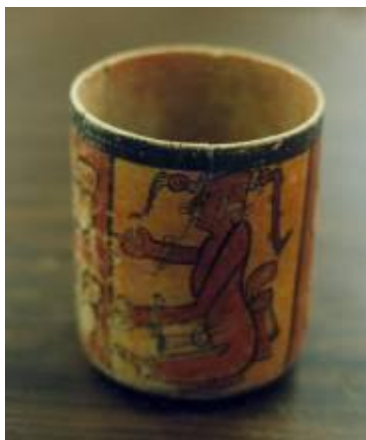
Figura No. 9 Piezas Repatriadas "MOU"