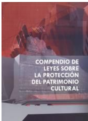
Figura No. 17. Recopilación de Leyes