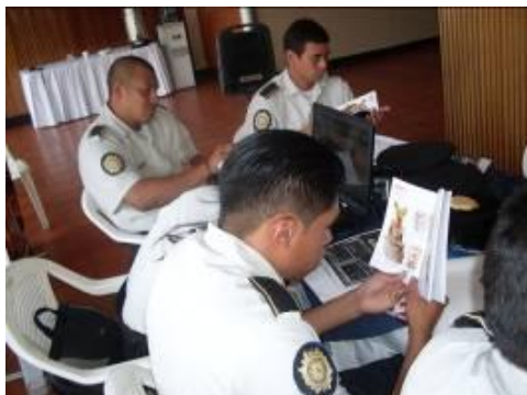
Figura No. 11 Capacitación Policía Nacional