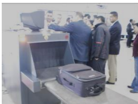
Fig.1 Capacitación personal seguridad Aeroportuaria