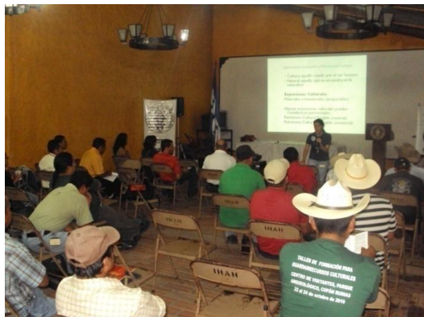
Figura 2. Taller de Guarda-recursos Culturales en Copán Ruinas, Copán.