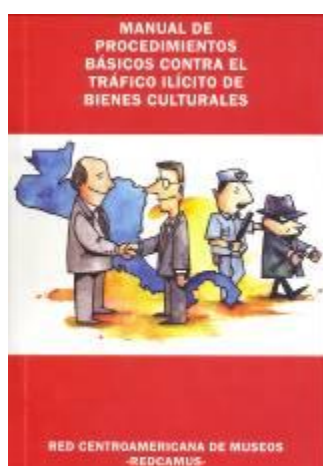
Figura No. 14 Manual Contra Tráfico Ilícito