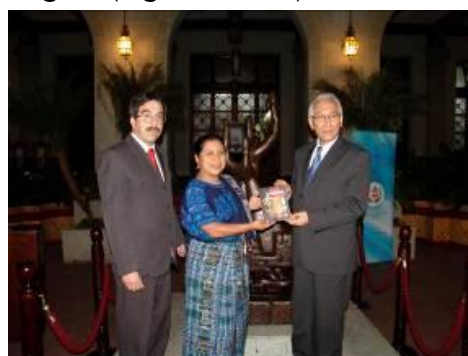
Fig. 2 Entrega lista de bienes